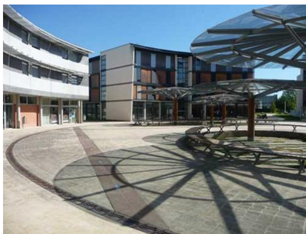
Studentboligene ved campus

Når man søker om skoleplass får man automatisk et skjema fra UTT hvor man kan sette opp en rangering av 6-7 ulike boligtyper. Du må så sende inn noen forsikringspapirer for at skolen skal kunne ordne alt som trengs slik at du kan flytte direkte inn når du ankommer. Man kan også velge å finne bolig selv, men da bør man være tidlig ute. Boligene som er foreslått fra skolen koster ca. 280-350 € og det varierer om strøm/internett/vann er inkludert, men dette kommer fram av alternativene. De har også en ordning som heter "Caf" som (selv om du kommer fra Norge) dekker en betydelig del av husleia! I mitt eksempel koster det 319 € og jeg fikk dekt 150€ av dette! For utvekslingsstudentene er hyblene (gitt at skolen finner en for deg) møblert. Du får en seng med madrass, skap, pult og stol, noen ganger også mer. Det lønner seg å kjenne noen som har gått her tidligere da det ikke alltid er kjøkkenredskaper i leiligheten fra før.