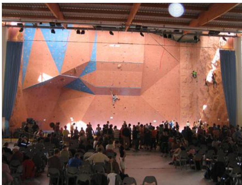
Klatrevegg i internasjonal skala

Sportstilbudet her er veldig bra. 200m unna skolen kan man finne en stor sportshall med styrkesal, dansesal, en svær klatrevegg og andre saler. Treningsprogrammet har mer enn 40 ulike aktiviteter man kan gjøre og det organiseres jevnlig kamper/konkurranser med de andre skolene og regionene. Svømmehall og en friidrettsarena er også bare et par hundre meter unna. Det er også en ganske stor park rett