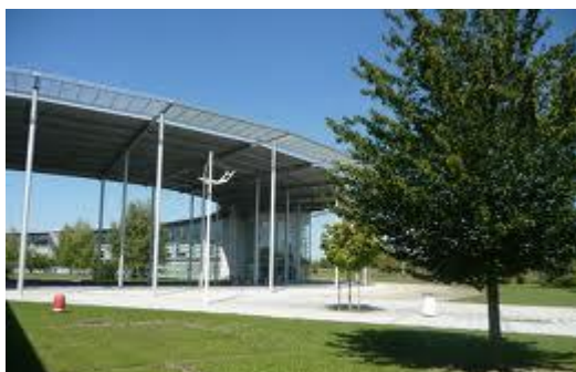
Litt av universitetet

Det koster ingen ting å gå her og man får stipend og lån som vanlig fra lånekassen.