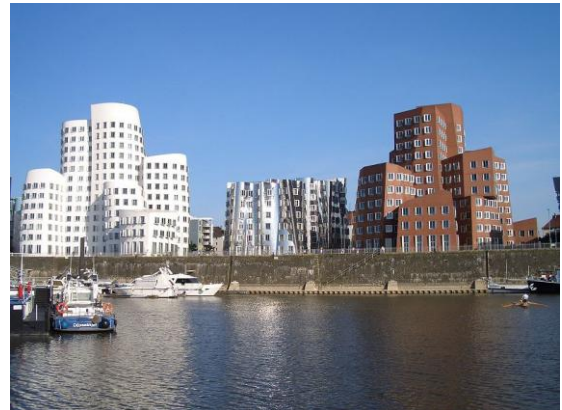
Moderne arkitektur ved Medienhafen