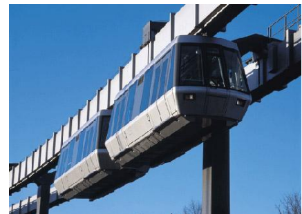
Terminaltoget på DUS Int. flyplass

En av de supre fordelene med Düsseldorf for deg som utenlandsstudent er at det aldri er langt hjem. Man behøver kun å ta toget fra Düsseldorf Sentralbanestasjon (som jo er gratis når man har studentbevis) til Düsseldorf lufthavn. Grunnen til at mange flyselskap har direkterute til Düsseldorf er fordi den er et av Tysklands viktigste økonomiske sentre.