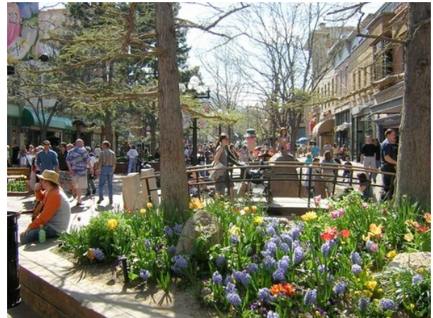
Bildet til venstre er Leeds School of Business og til høyre er Pearl Street Mall.