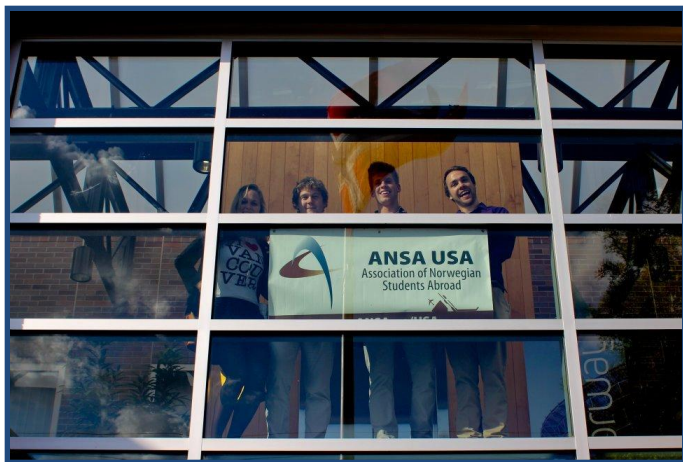
ANSA USA på høstseminar i Houston, Texas.